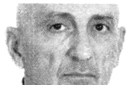
השופט אדמונד לוי

לפרקליטיו של פרי להגיש ראיות, ולפיהן משרד האוצר אישר לכאורה את גובה הפרמיות שגבה פרי. השופט ריבלין לא התיר לקיים דיון נוסף בהרשעתו של פרי בע"בירה של קבלת דבר במרמה. המרמה היא קבלת הסכמתם של הפנסיונרים להתקשר בהסכם ב"טוח בלי לדעת שהחברה המבטחת מצויה בעצם בשליטתו של פרי. המרמה מתבטאת בשליטת "חופש הבחירה ושיקול הרעת" של הלקוחות, גם אם לא נפגעו כלל באופן מוחשי, מסביר ריבלין.