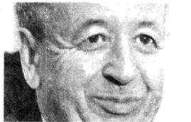
השופט אליעזר ריבלין