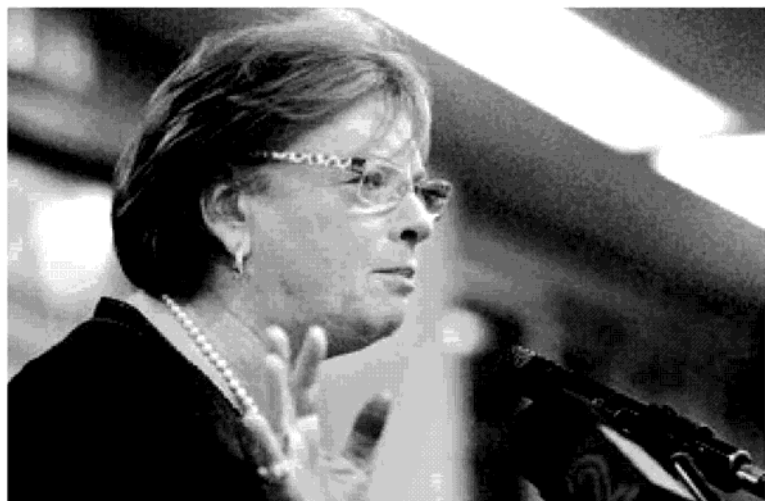
לדור חתום בעצמו על הבקשה. ביניש

מאז פרישתה של השופטת דליה דורנר מבית המשפט העליון, לפני חמש שנים, היא הספיקה לעסוק במספר כה רב של עיסוקים, שאפשר לומר שהיא פצחה בקריירה שנייה. מלבד תפקידה כנשיאת מועצת העיתונות, ולצד עמידתה בראש ועדת החקירה הממלכתית לבריאת טיפול המדינה בניצולי השואה, דורנר ניצבת בחזית הדוברים הציבוריים מבין שופטי העליון בדימוס, שהתייצבו להגן על בית המשפט העליון במאבקו הציבוריים הפוליטיים.