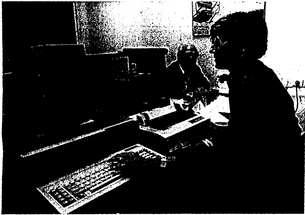
יעצת השקעות של הארגון בודקת, נתונים של זכאי לפנסיה

ביותר. כאמור אין הזכאי חייב להשקיע מכספו וכל ההשקעה נעשית באמצעות בנק בחרי"ל המממן את תשלום רכי שות זכויות הפנסיה רטרואקטיבית. זאת ועוד: המימון וההשקעה ממקורות בחרי"ל נעשים באישור בנק ישראל ומשרד האוצר על-פי היתר מיוחד לצרכי מיר מוש הזכויות המוקנות לישראלים. על פי האמנה שנחתמה בין ישראל לבין גרמניה המערבית בנושאי הבי